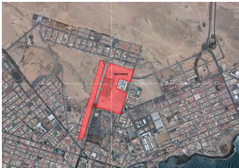
Ubicación de la zona de actuación (Puerto del Rosario)

El Sector SUP R-1 tiene una superficie de 146.037 m 2 correspondiendo la ejecución de las obras de urbanización a la Junta de Compensación del Sector SUP R-1, y no se incluye en el ámbito del sector los dos Sistemas Generales adscritos (SG- 1 y SG-8), por estar excluidos del mismo, ya que su ejecución no corresponde a la Junta de Compensación, sino a la Administración competente.