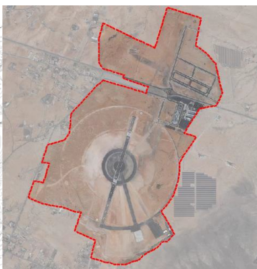
Ámbito de actuación de la Modificación y su visualización sobre ortofotografía.