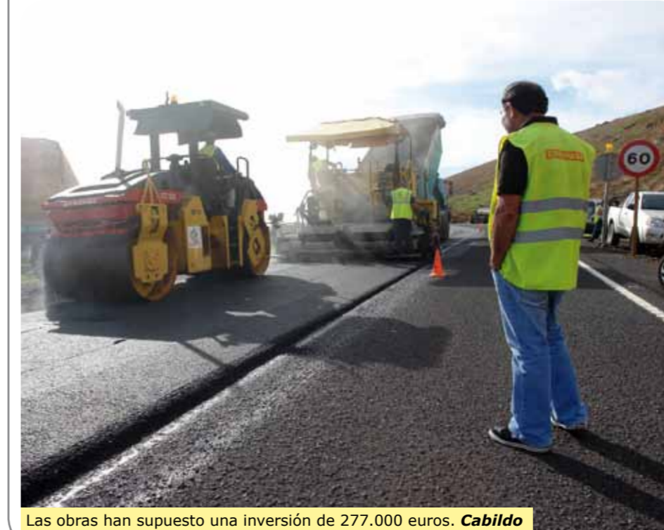
Las obras han supuesto una inversión de 277.000 euros. Cabildo

CABILDO DE FUERTEVENTURA El Cabildo ha finalizado las obras de repavimentación de la carretera FV-30, vía que conecta la FV-20 desde Casillas del Ángel con la glorieta de acceso a Betancuria, pasando por las localidades de Llanos de La Concepción y Valle de Santa Inés.