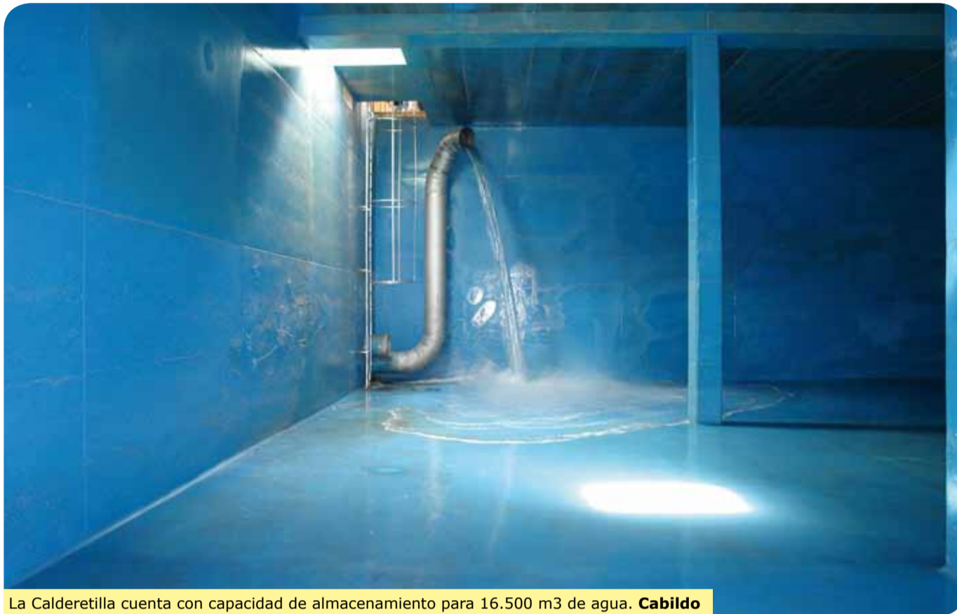
La Calderetilla cuenta con capacidad de almacenamiento para 16.500 m3 de agua. Cabildo