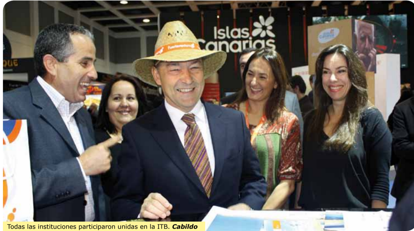
Todas las instituciones participaron unidas en la ITB. Cabildo

CABILDO DE FUERTEVENTURA Fuerteventura participó en la Feria Internacional de Turismo de Berlín (ITB) 2010, contando con la presencia del Patronato y la Consejería de Turismo en un programa de encuentros dentro de una estrategia conjunta consensuada con los ayuntamientos mayoreros y el empresariado turístico insular.