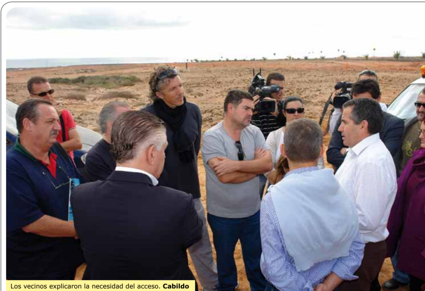
Los vecinos explicaron la necesidad del acceso. Cabildo