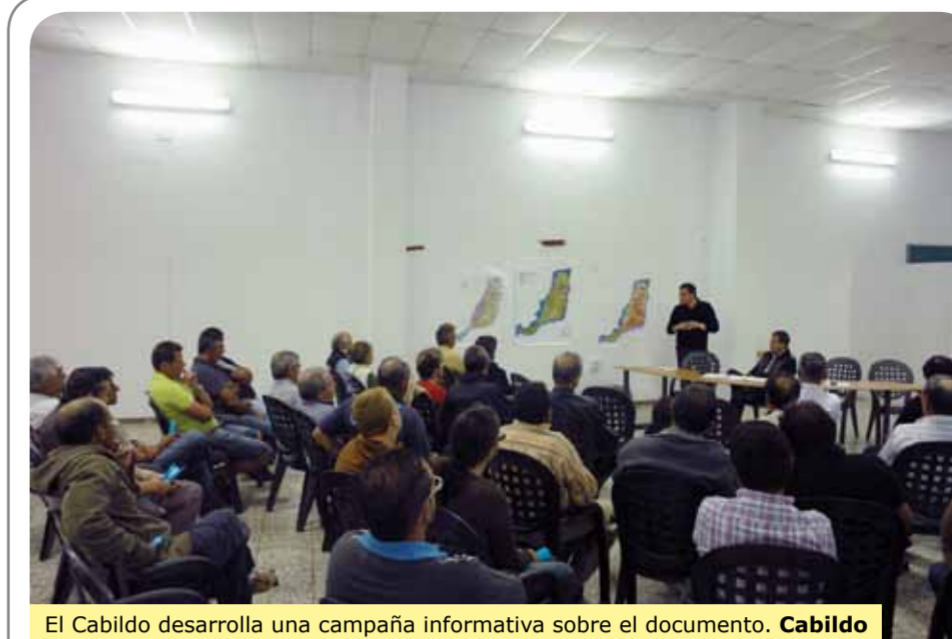
El Cabildo desarrolla una campaña informativa sobre el documento. Cabildo

El Cabildo de Fuerteventura y el Gobierno de Canarias, aportan a cada uno de los dos Centros de Días de Rehabilitación Psicosocial un total de 108.000 euros. "En Puerto del Rosario venía funcionando hasta ahora en unas instalaciones alquiladas y en breve queremos abrir un edificio específico destinado exclusivamente a ello. En Gran Tarajal también está en construcción un edificio con la misma finalidad.