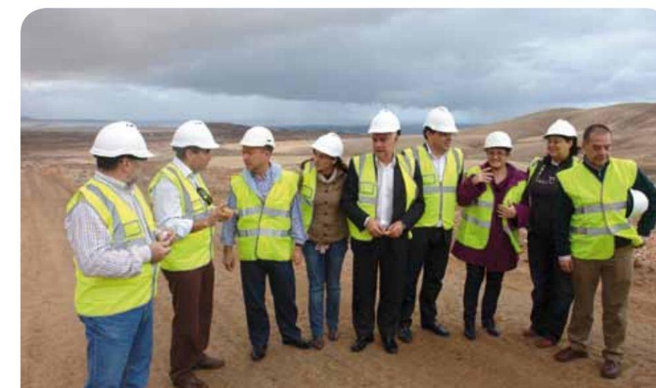
Autoridades locales y regionales durante la visita a las obras de la nueva autovía.

La autovía está incluida en el proyecto del Eje Insular de Fuerteventura y su ejecución viene siendo desarrollada por el Gobierno de Canarias dentro del convenio firmado con el Estado.