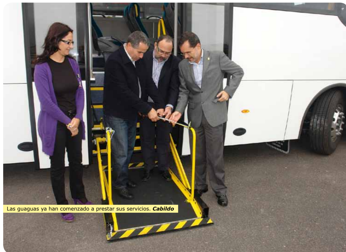
Las guaguas ya han comenzado a prestar sus servicios.