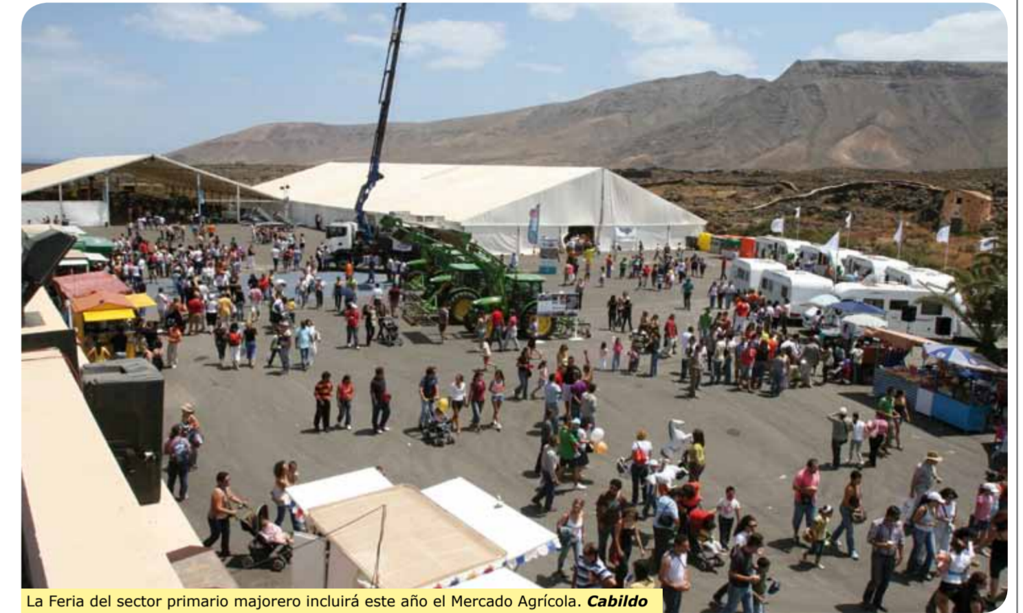
La Feria del sector primario mayorero incluirá este año el Mercado Agrícola. Cabildo

Feaga 2010, incluirá también las Jornadas Ganaderas, que se desarrollarán durante los días