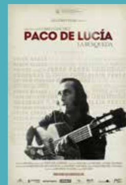
Jueves 3 noviembre 21:00h