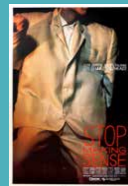
Domingo 6 noviembre 11:00h