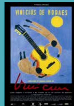
Viernes 4 noviembre 17:00h