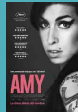
Sábado 5 noviembre 12:00h